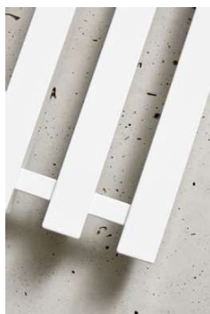
PLUTO P2W/4 vyhotovenie biela 245 x 1500 mm