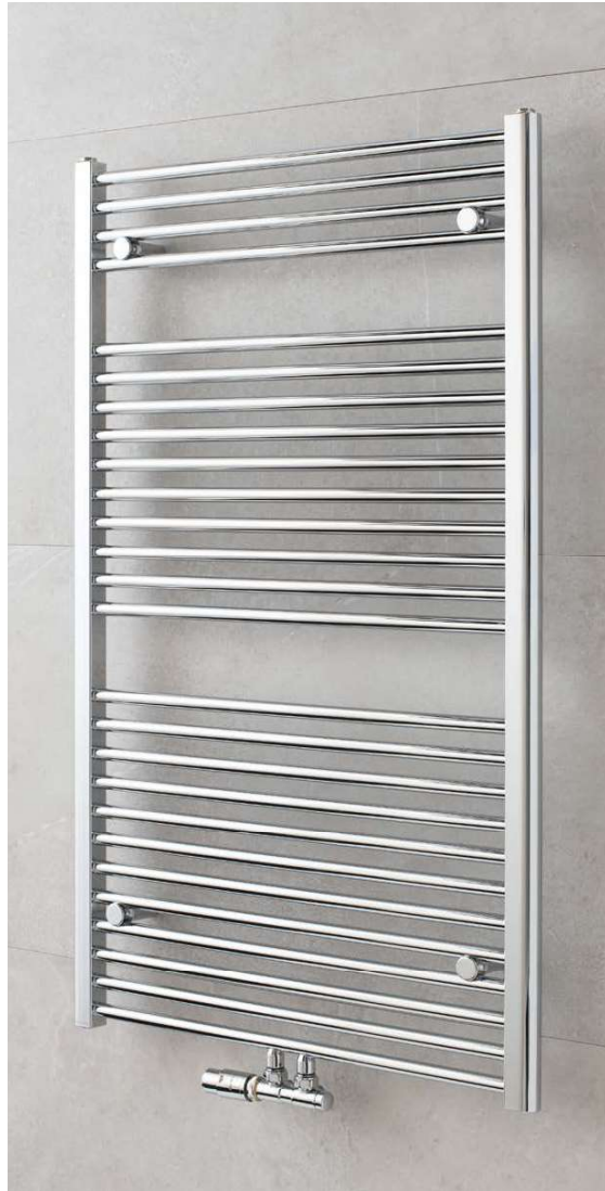
SAVOY CS5-M – provedení chrom 600 x 1210 mm