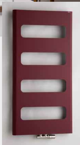
RETRO – provedení strukturální bordó 600 × 1200 mm

Umístění „uchycení“ na stěnu: ↓ 82 mm ↑ 82 mm Centrální vytápění: ANO Kombinované vytápění: ANO Elektrické vytápění: ANO