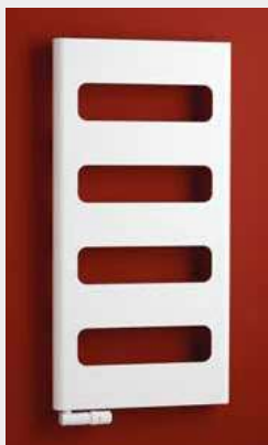
RETRO – provedení strukturální bílá 600 × 1200 mm