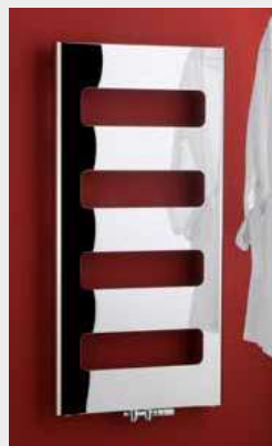
RETRO – provedení chrom 600 × 1200 mm